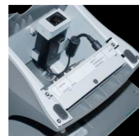
Adaptateur d'alimentation intégré